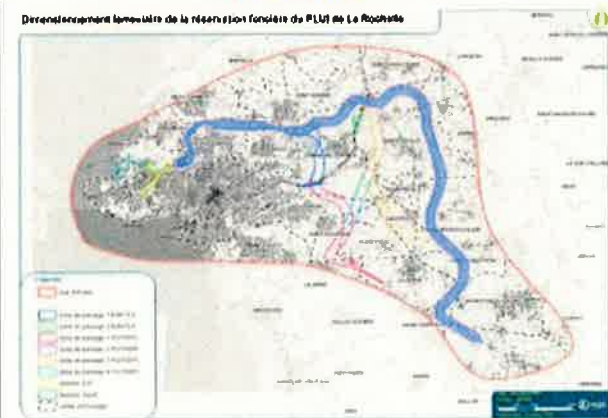
Scénario ZPP4 P