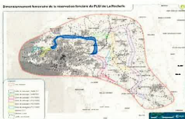
Scénario ZPP1 N

- Raccordements courts sur la ligne Nantes ↔ La Rochelle :