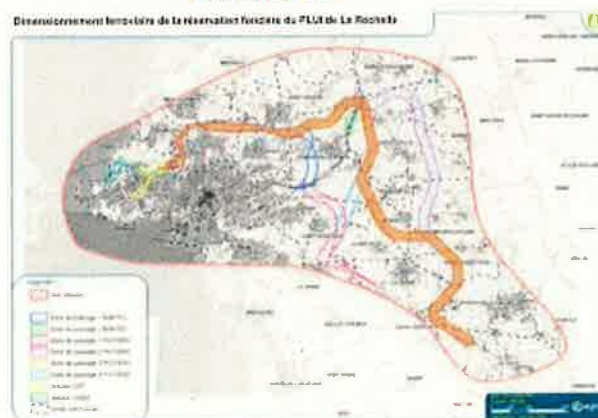
Scénario ZPP3 P