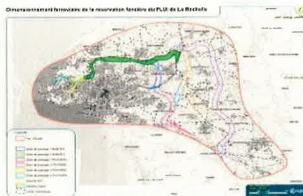
Scénario ZPP2 N

- Raccordements longs sur la ligne Poitiers ↔ La Rochelle :