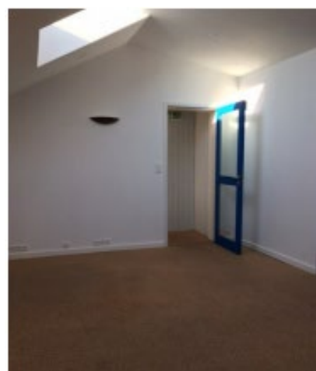
Une vue de l'intérieur