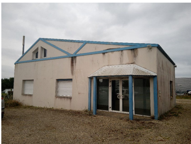
Façade du bâtiment

Ce bâtiment relais est situé 4 rue Pasteur à PERIGNY (17180).