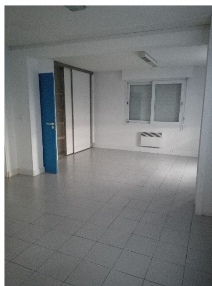
Une vue de l'intérieur