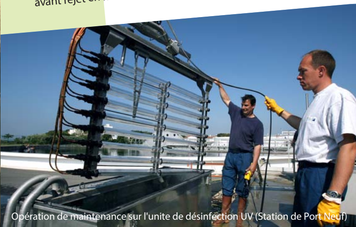
Opération de maintenance sur l'unité de désinfection UV (Station de Port Neuf)

La station d'épuration de Port Neuf, la plus importante de la CdA, reçoit chaque jour 11 000 kg de pollution organique et 8 150 kg de matières en suspension. Elle a la capacité de traiter une pollution équivalente à 170 000 habitants . En 2020, elle a permis d'éliminer plus de 96 % de la pollution , avant rejet en milieu naturel.