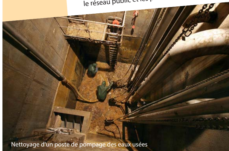
Nettoyage d'un poste de pompage des eaux usées