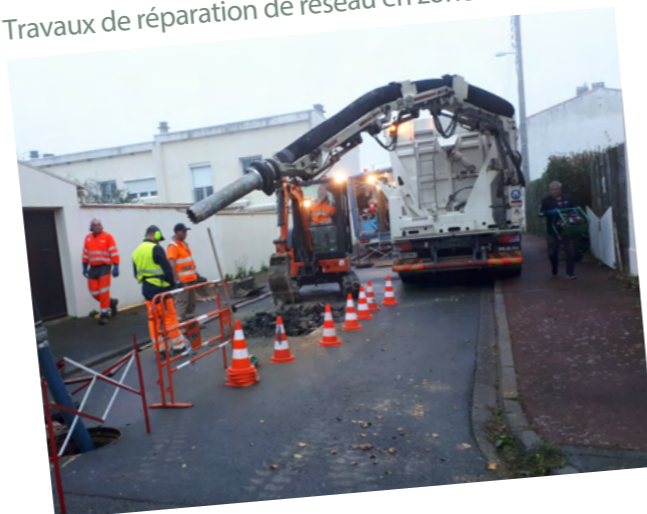
Travaux de réparation de réseau en zone urbaine.

6 841 573 € Travaux d'extension, de réparation et de réhabilitation réalisés au niveau du système de collecte (branchements, collecteurs, postes de pompage) et travaux de construction d'ouvrages neufs. Renouvellement des équipements et des matériels d'exploitation.