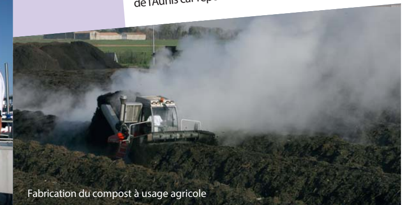
Fabrication du compost à usage agricole

Le compost est fabriqué par mélange des boues déshydratées, sous forme pâteuse, avec des déchets verts. Une période de 6 à 8 mois est nécessaire à l'obtention d'un compost parfaitement hygiénisé et stable. Il est ensuite épandu sur les sols agricoles de l'Aunis car répondant aux normes NFU-44-095.