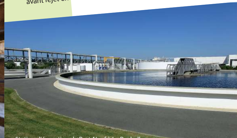
Station d'épuration de Port-Neuf à La Rochelle