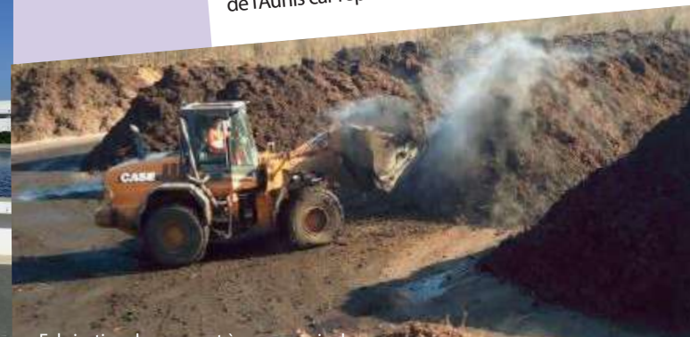
Fabrication du compost à usage agricole

Le compost est fabriqué par mélange des boues déshydratées, sous forme pâteuse, avec des déchets verts. Une période de 6 à 8 mois est nécessaire à l'obtention d'un compost parfaitement hygiénisé et stable. Il est ensuite épandu sur les sols agricoles de l'Aunis car répondant aux normes NFU-44-095.