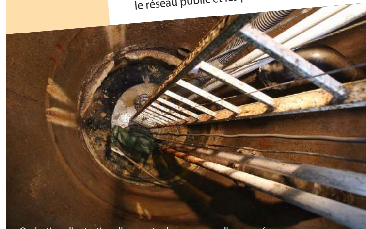
Opération d'entretien d'un poste de pompage d'eaux usées