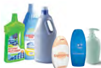
Bidons et flacons de produits ménagers et d'hygiène