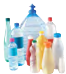
Bouteilles et bidons alimentaires