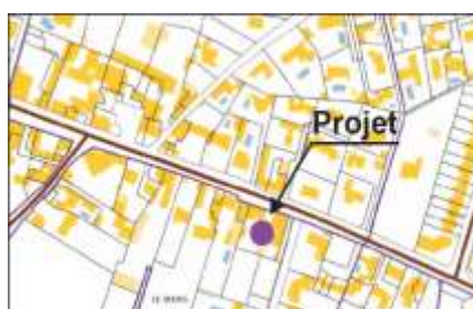
Plan cadastral :