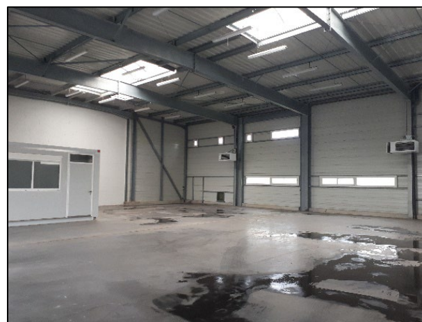
Une vue de l'intérieur