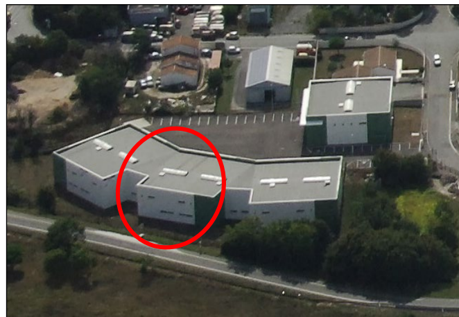
Photo oblique du bâtiment

Ce local d'activités d'une superficie totale de 475,70 m 2 comprend un plateau principal avec accès soit par la façade avant (porte de service et porte de garage), soit par la façade arrière (porte de service). Celui-ci comprend un bureau, deux vestiaires, deux WC et une structure mobile de type modulaire de 25 m 2 .