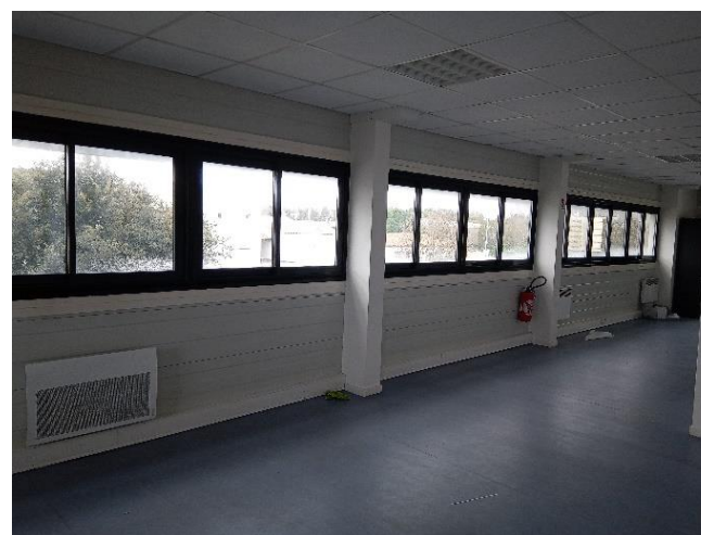
Une vue de l'intérieur