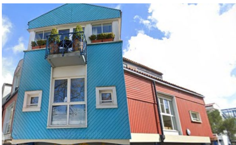
Une vue de l'extérieur angle port/contre-allée (1 er étage)

Au sous-sol, le bien dispose de deux espaces de stationnement fermés par des portes de garage. Aucun travaux d'aménagement n'est à prévoir. Le bien est disponible et mis à disposition en l'état.