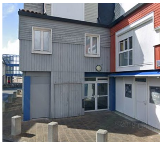
Entrée depuis la contre-allée (RDC)