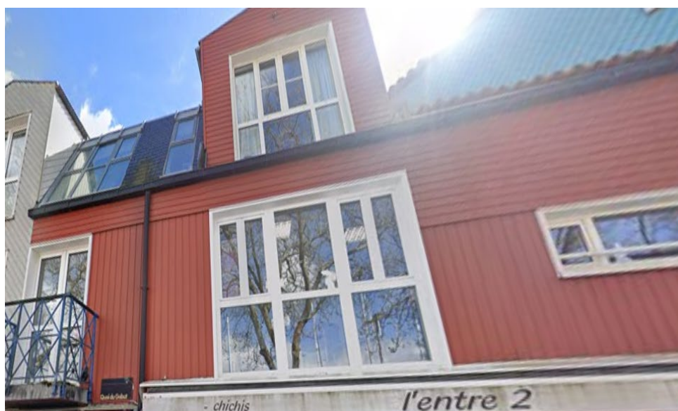
Façade du bâtiment

Ce local relais est situé 16 rue de l'Aimable Nanette – Bât E (LA ROCHELLE 17000).