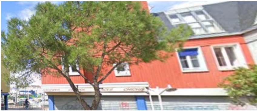
Vue des 4 fenêtres arrière (1 er étage)